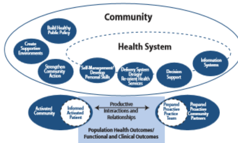
Figure 2. The Expanded Chronic Care Model: Integrating Population Health Promotion

Created by: Victoria Barr, Sylvia Robinson, Brenda Marin-Link, Lisa Underhill, Anita Dotts & Darlene Ravensdale (2002) Adapted from Glasgow, R., Orleans, C., Wagner, E., Curry, S., Solberg, L. (2001). "Does the Chronic Care Model also serve as a template for improving prevention?" The Milbank Quarterly , 79(4), and World Health Organization, Health and Welfare Canada and Canadian Public Health Association. (1986). Ottawa Charter of Health Promotion.